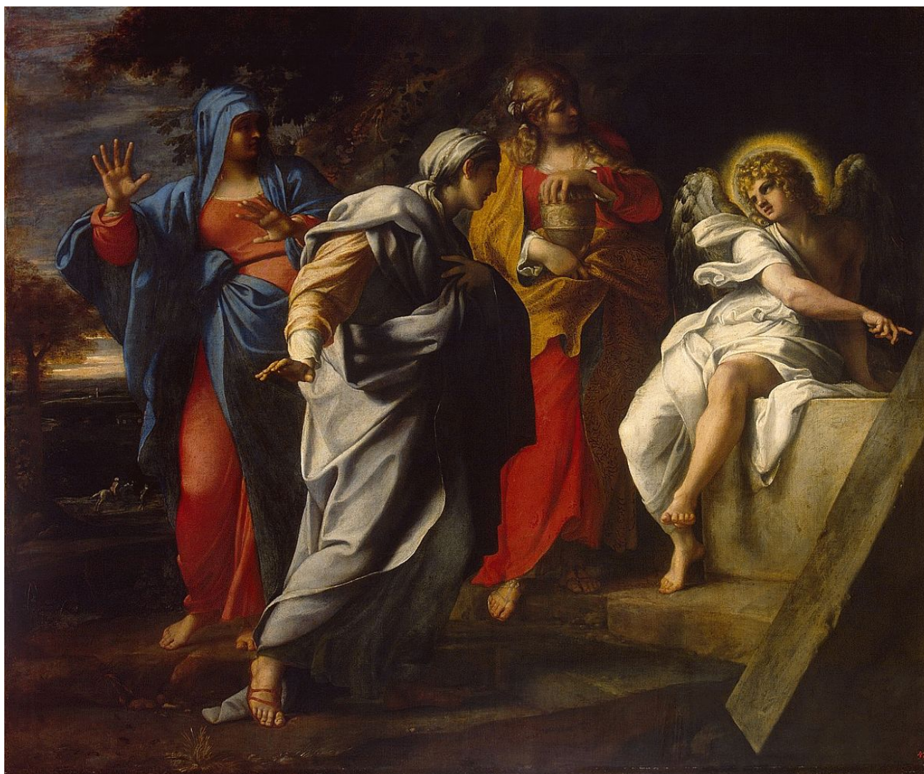
Annibale Carracci (1560–1609), Donne al sepolcro (Ermitage, San Pietroburgo)

M ULIERES SEDENTES è una breve composizione, quinta ed ultima parte di un lavoro più ampio, che porta il titolo di Piccolo Passio . I testi delle cinque composizioni in cui si articola il Piccolo Passio sono citazioni evangeliche, riportate in alcune antifone della Settimana Santa.